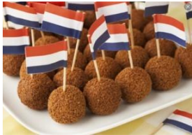
Omdat opleiden werkt!