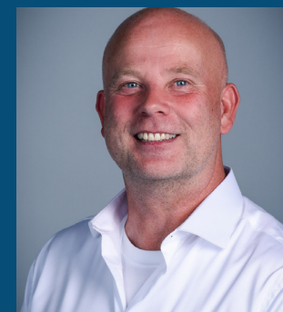
Ben Korving Installatietechniek

Het team bestaat uit 7 instructeurs, verspreid over de locaties binnen Zuid-Holland, met elk een eigen richting. Onze Missie is toekomstige vakmensen op te leiden voor het vakmanschap binnen de Technische Installatiebranche. Maar ook willen we laten zien en ervaren hoe mooi de techniek is en het perspectief voor hen. W