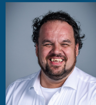
Kevin Broer Elektrotechniek