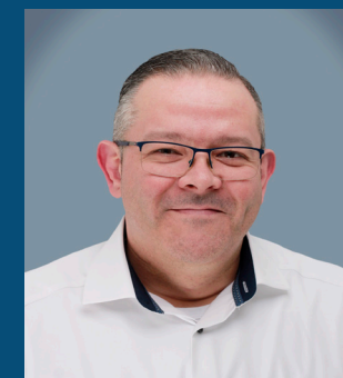
Lino Noya Mahn Installatietechniek