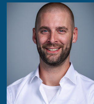
René Luijten Training & Advies