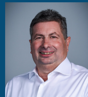
Kees Put Elektrotechniek