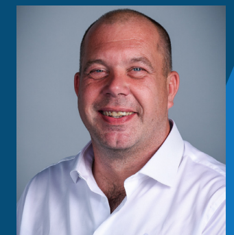
Jaco van Oosten Installatietechniek