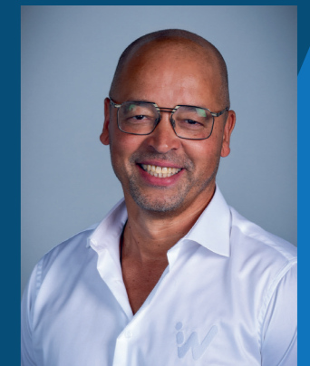
Jeffrey de Man Omgeving Rijnmond